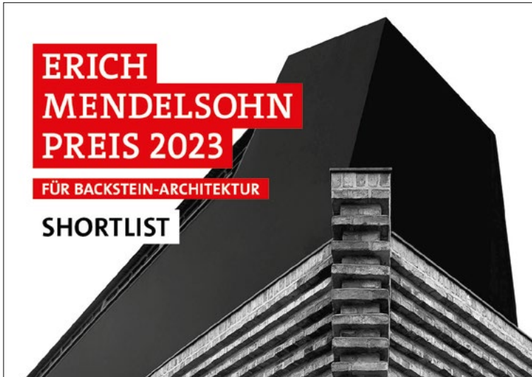
Bildunterschrift: 76 Projekte haben es auf die Shortlist des Erich-Mendelsohn-Preises 2023 für Backstein-Architektur geschafft.